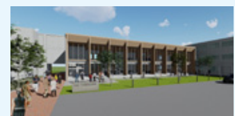
100周年記念施設イメージ

一定額以上のご寄附（個人10万円以上、法人50万円以上）をいただいた場合は、芳名板にご芳名を刻み、末永く顕彰させていただきます。